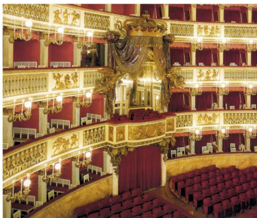
Teatro di San Carlo - Napoli 1737