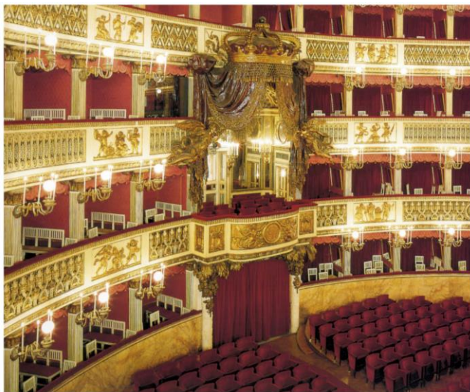
Teatro di San Carlo - Napoli 1737